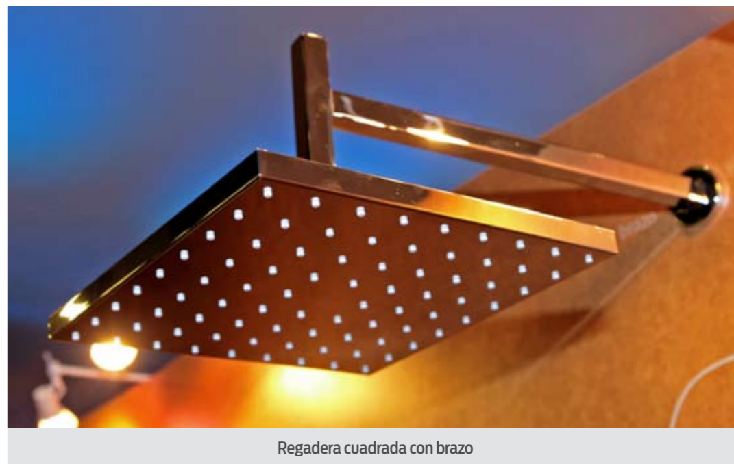
Regadera cuadrada con brazo