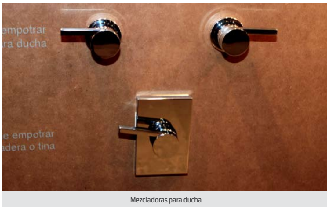
Mezcladoras para ducha