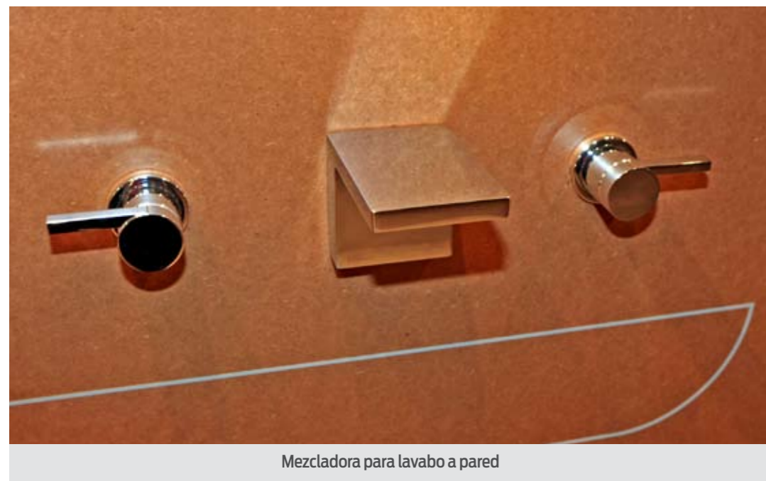
Mezcladora para lavabo a pared