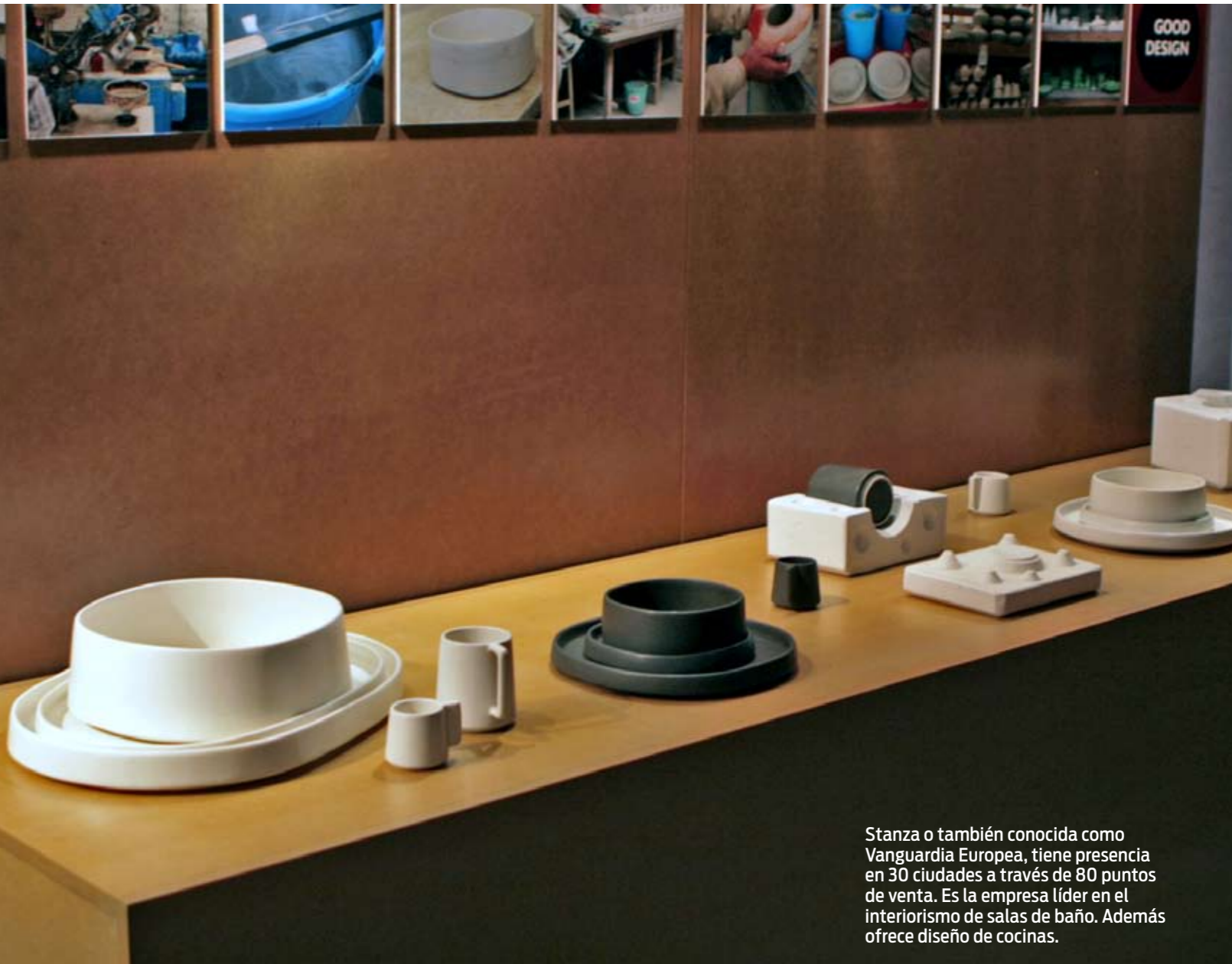
Línea de vajillas

Año tras año se invierten en Gritec millones de dólares para mantenerla a la vanguardia e incrementar su capacidad de producción de alta tecnología.